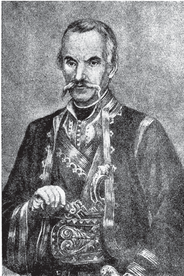
Чолак Анта Симеоновић

„Чолак Анта Симоновић, крушевачки војвода, родио се у Призрену око 1877 год. У младости је у Београду имао ђурчиску радњу. Пред Карађорђевог устанак пође трговачким послем у Призрен, и том приликом повере му београдске дахије, да за њих у Призрену накупује оружја, а нарочито тешких пушака. На повратку, са седам тогара пушака, чује да је Карађорђе дигао устанак. Он тада са пушкама оде право у Тополу, преда Карађорђу оружје, те се придружи устаницима, и од то доба је све до пада Карађорђевог Србије био уз Карађорђа. Карађорђе га је, у име награде за његова јуначка дела, године 1809 поставио за војводу сеничког, а доцније, 1811, за крушевачког. Након пада Карађорђевог Србије прелази преко Саве у Срем, те заједно са Кара-